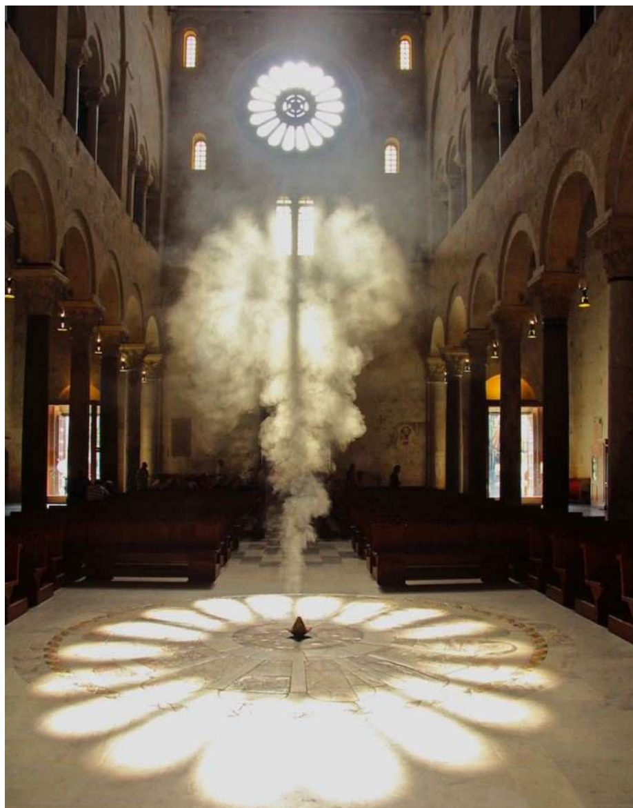
“Meravigliosa Luce”

La foto ritrae lo spettacolo di luce creato dai raggi del sole nella Cattedrale di Bari, costruita tra il XII e XIII secolo e situata nel centro storico di Bari, cuore della città. Il 21 giugno, giorno del solstizio d'estate, alle 17.10, i raggi del sole filtrano dal rosone della facciata riproponendo una proiezione dello stesso sul pavimento e sovrapponendosi all'identico rosone pavimentale. La Fondazione ha sostenuto, e continua a sostenere, un importante intervento di restauro delle vetrate artistiche di transetto e navate laterali della Cattedrale. Esse sono costituite da un telaio ligneo di particolare spessore e pannelli di vetroresina. Il restauro prevede il trattamento completo di tutti i telai in legno, con stuccatura e verniciatura e sostituzione dei pannelli in plastica con pannelli in vetro soffiato di colore giallo paglierino che doneranno alle navate interne della Basilica nuova luce e colore.