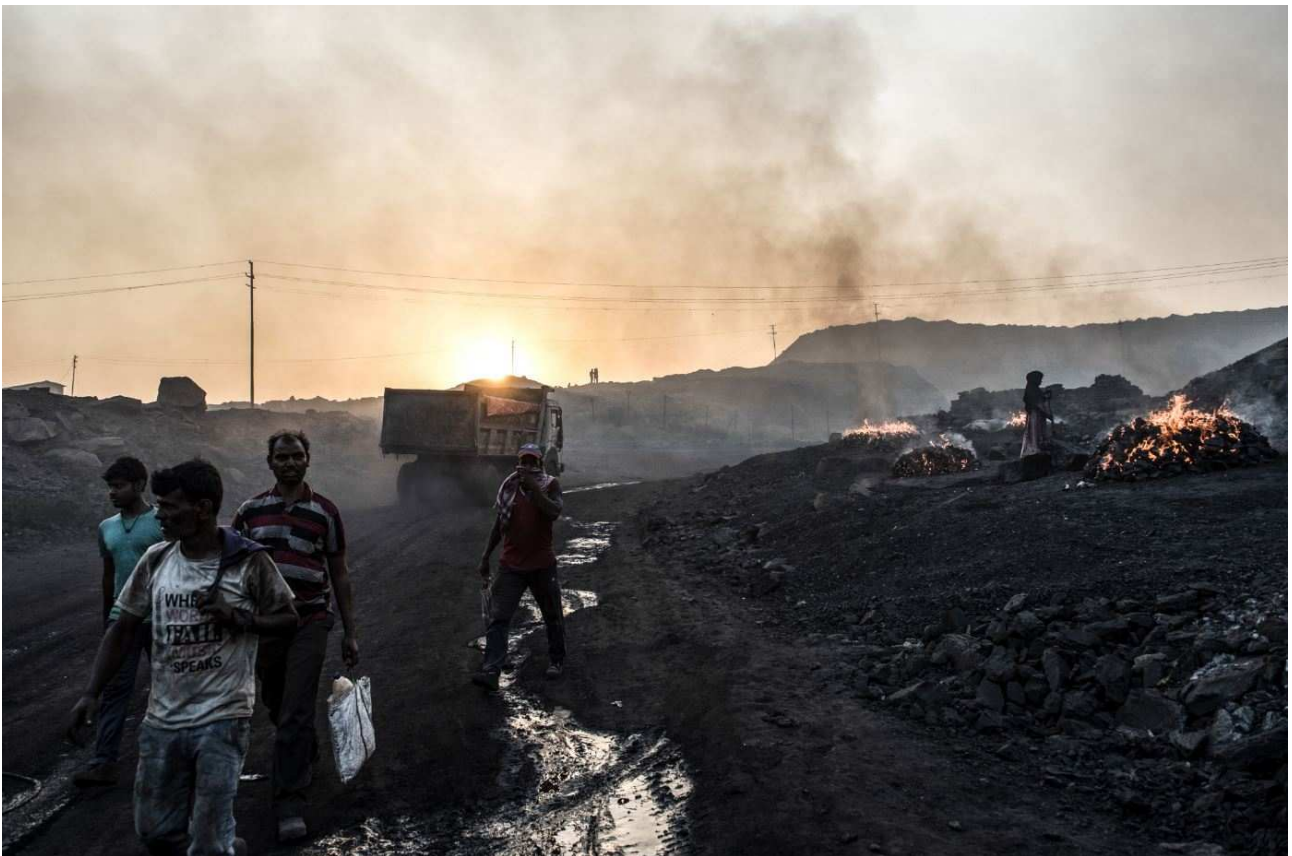
“Il fuoco della terra”

Il Fuoco della Terra del fotoreporter pescarese Stefano Schirato è un capitolo di un progetto in corso a lungo termine sull'inquinamento ambientale, dedicato alla situazione della regione di Jharia, in India, dove si trova uno dei giacimenti di carbone più grandi del mondo. La Fondazione Pescarabruzzo ha sostenuto il progetto, realizzando una mostra con relativo catalogo nel 2019. Diverse sono state le collaborazioni tra il fotografo e la Fondazione nel corso degli anni: la mostra “Chernobyl 25” (2011), per ricordare il venticinquennale del disastro nucleare e “Radan, Inshallah. Domani, se Dio vuole” (2014), esposizione fotografica per denunciare le persecuzioni sul popolo Saharawi a sud del Marocco.