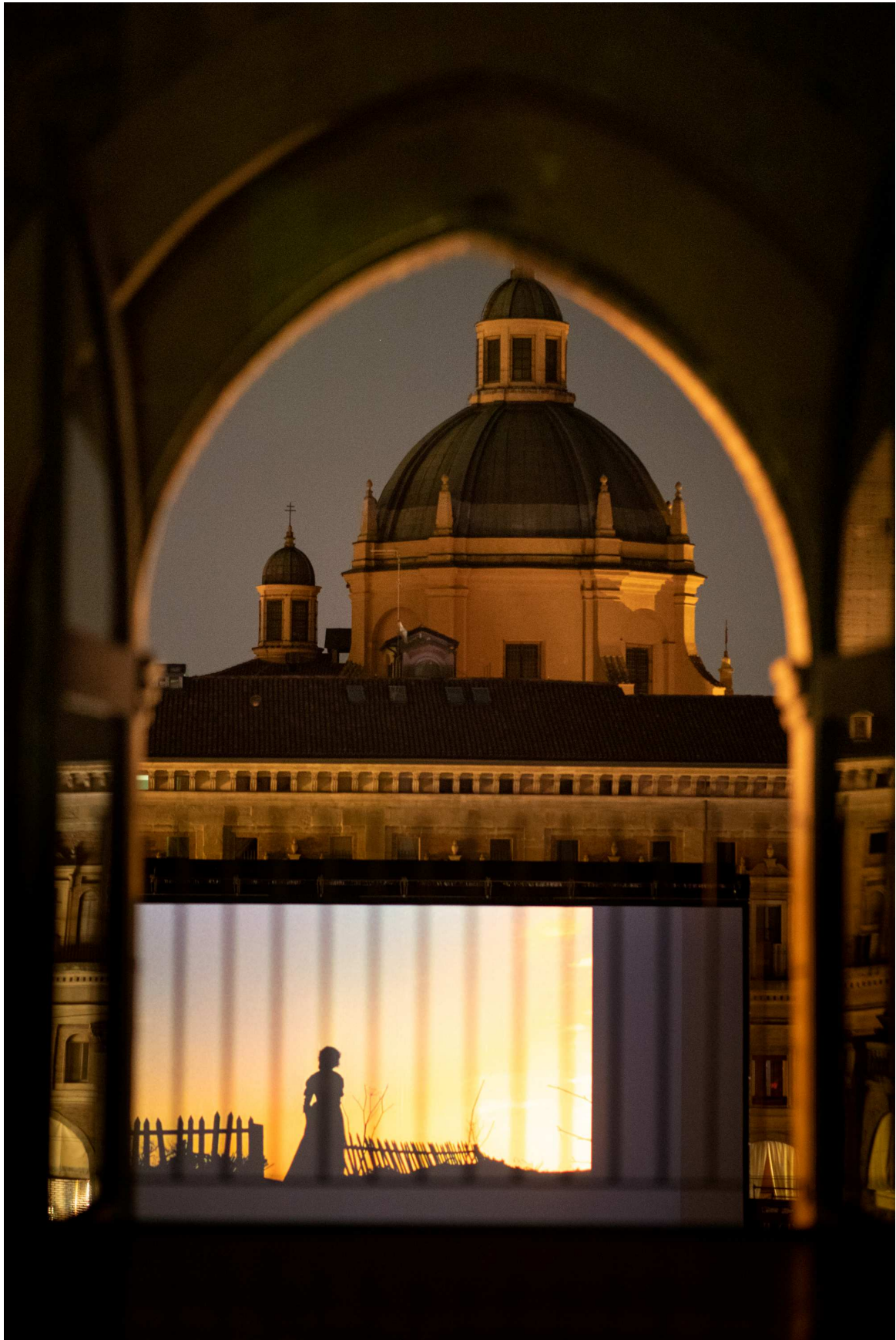
“Sotto le Stelle del Cinema”