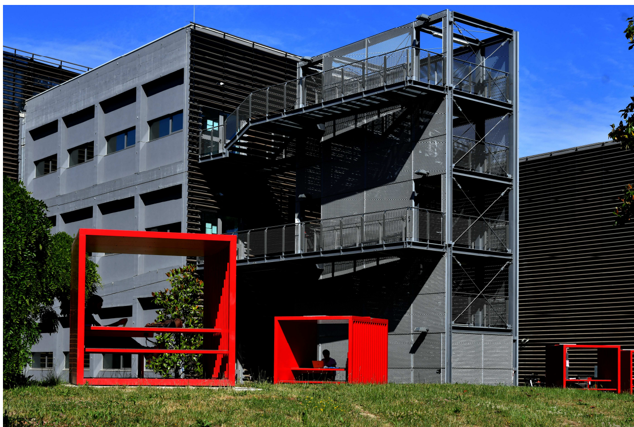
“Le energie del futuro”

La foto ritrae l'area verde che circonda il Teaching Hub del Campus Universitario di Forlì, facendo dialogare le energie intellettuali del futuro (gli studenti) con i dispositivi energetici del futuro (ovvero le cabine rosse a pannelli solari). Il progetto di riqualificazione dell'area, voluto dalla Fondazione di Forlì, rappresenta un intervento di rigenerazione sostenibile a zero consumo di suolo di cui gli arredi rossi sono il simbolo: sono infatti a disposizione sia degli studenti sia dei cittadini e offrono, oltre ad una comoda zona di studio, uno spazio in cui ricaricare i propri dispositivi elettronici, grazie all'energia prodotta dai pannelli solari posti sopra ogni cabina. I 5 ettari del parco, in pieno centro storico, sono aperti a tutti, facendo del Campus una parte integrante e trainante del cuore di Forlì.