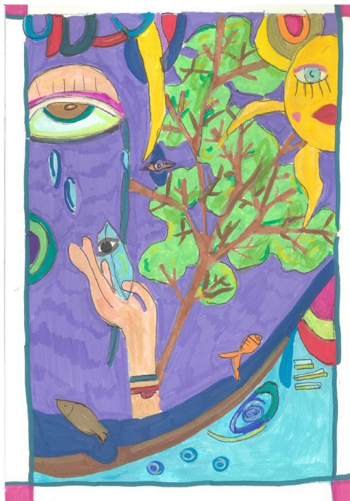
"Lettura di un cambiamento", Tiziana