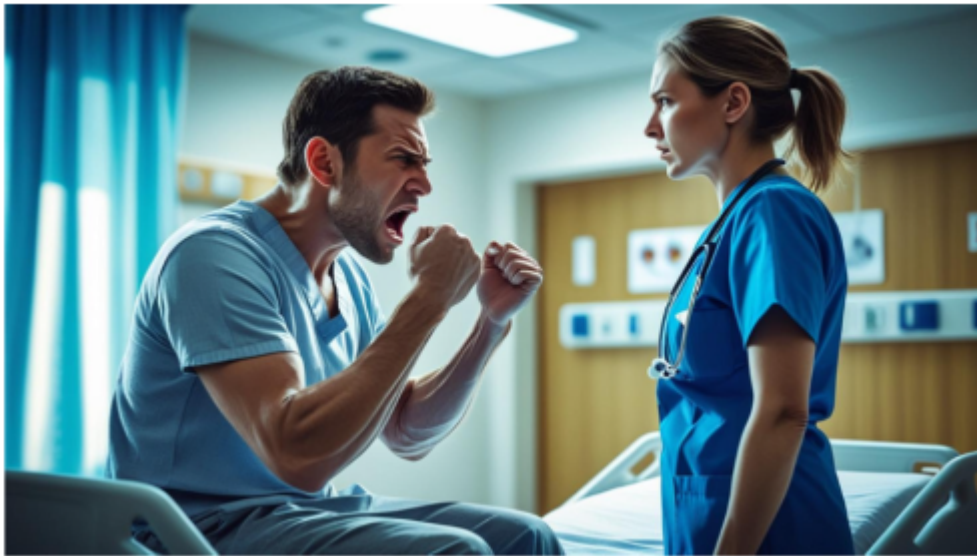
"Immagine generata con l'intelligenza artificiale di Canva

Corso in presenza per gli operatori e seminario istituzionale con la Questura di Biella