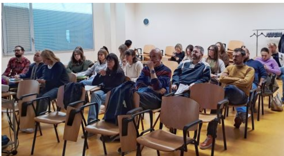
I discenti al corso.

Il corso ha avuto lo scopo di far acquisire le competenze di base nella tecnica ecografica affinché medici e infermieri impegnati nell'urgenza, possano intraprendere in modo omogeneo percorsi diagnostici e terapeutici accurati ed efficaci.