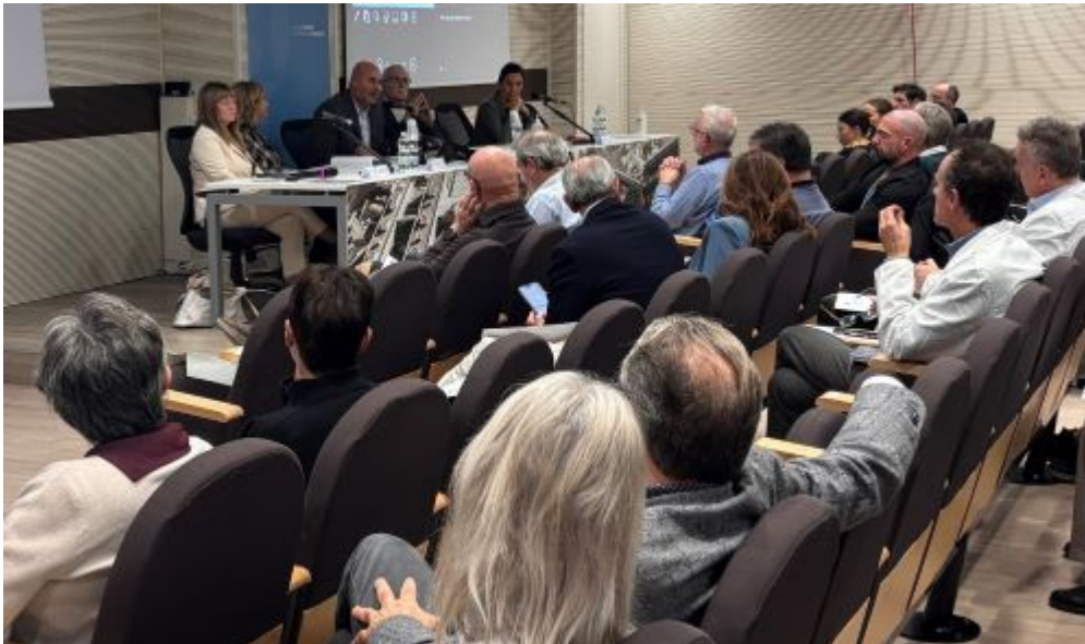
I rappresentanti delle Istituzioni.

Il seminario è stato il primo in Piemonte organizzato in tandem tra Azienda Sanitaria e Questura/Polizia di Stato e ha rappresentato un momento importante di rafforzamento della collaborazione tra Istituzioni e di consolidamento della cultura della sicurezza negli ambienti di cura sanitaria.