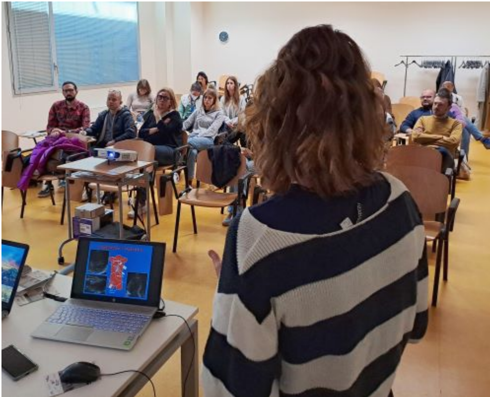
I discenti e la docente.