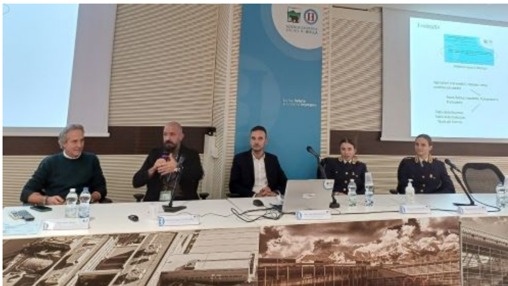
I relatori della tavola rotonda.